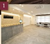
1 階ロビーでお待ち合わせ