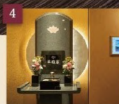
当家的お厨子を自動で搬送