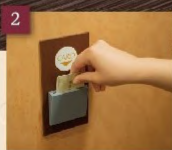
参拝ブースでカードを差込